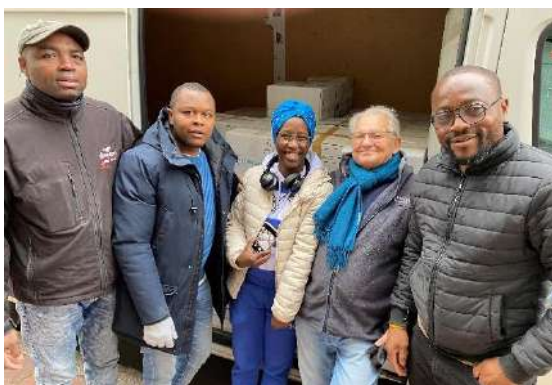
départ pour le Cameroun

Après une décennie faste et une année 2023 satisfaisante avec 146 900 livres offerts, il est clair que nous abordons un tournant. Nous n'avons en effet offert que 19 200 livres au premier trimestre, et les contacts en vue de demandes sont rares.