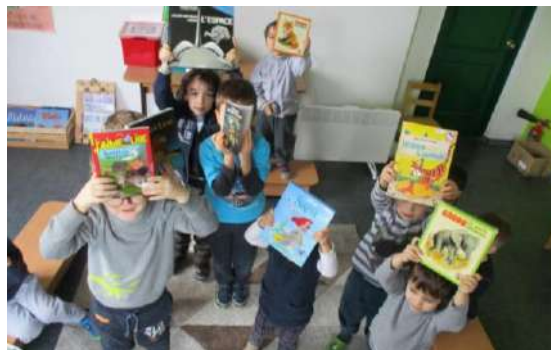
arrivée en Ukraine

Grâce à la conjonction de toutes ces bonnes volontés, notre existence n'est donc pas menacée à court terme mais à moyen terme, la démolition de notre local reste un sujet de préoccupation.