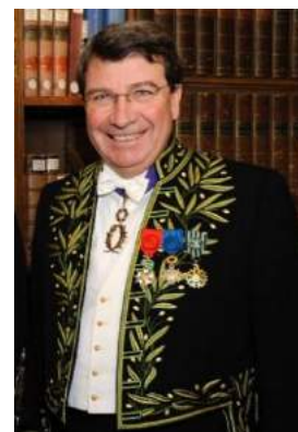
Xavier Darcos, Chancelier de l'Institut de France

C'est pourquoi j'adresse à l'association « le bouquin volant », qui œuvre si activement à faire aimer les livres, la lecture et la langue française, tous mes remerciements et mes vœux de succès.