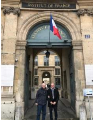
Le Bouquin Volant à l'Institut de France février 2020

Certains ne se posent pas la question. Vous connaissez sans doute cette mauvaise plaisanterie. Un père demande à son fils ce qu'il souhaite pour Noël : « – Veux-tu un livre cette année ? – Un livre ? mais j'en ai déjà un. »