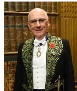
Michel Zink de l'Académie Française

Mais aujourd'hui, seize ans et une révolution numérique plus tard, le miracle des bouquins qui volent est porteur d'un autre message. Pourquoi, dirait-on, faire encore voler de lourds bouquins ? Ne vaut-il pas mieux équiper la planète entière en tablettes et en téléphones portables ? La réponse à cette objection n'est pas seulement dans la constatation pratique qu'il n'y a pas de connexion internet partout. Elle est surtout dans une autre constatation, plus grave : celle qu'une forme de l'attention et une aptitude à s'imprégner d'un texte menacent de se perdre avec la disparition du livre. Accéder à l'éducation en sautant l'étape du livre est dangereux. Aussi dangereux pour les pays saturés de livres que pour ceux qui en sont privés. Tous les pays du monde sont exposés à ce danger. C'est au secours de tous désormais que les bouquins doivent voler.